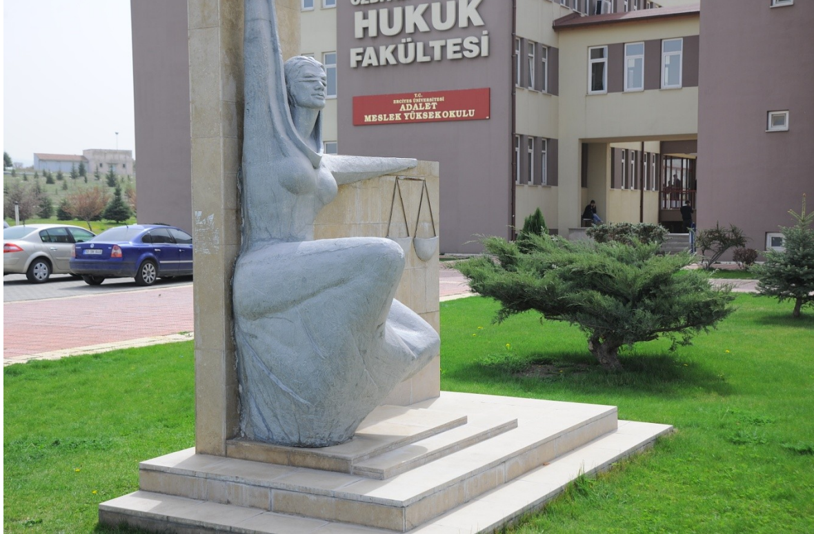
Tablo 1.3.Eğitim Alanları Derslikler

Meslek Yüksekokulumuza ait bağımsız bir binanın bulunmaması nedeniyle Hukuk Fakültesi Binası derslikler bloğunda iki sınıf ve bir bilgisayar laboratuvarı ile eğitim-öğretim hizmeti sürdürülmektedir. Bu binada kullanmakta olduğumuz 2 (iki) adet öğrenci dersliği bulunmaktadır. Yüksekokulumuza ait bilgisayar laboratuvarı bulunmamakla birlikte ortak olarak Hukuk Fakültesi laboratuvarı kullanılmaktadır.