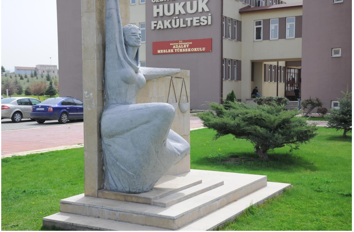
Tablo 1.3.Eğitim Alanları Derslikler